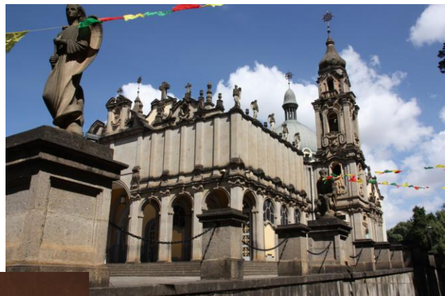
de Trinity church..

Aan kerken geen gebrek in Adis. De St.George kathedraal, gebouwd door Menelik om de troepen te eren die de Italianen hebben verjaagd, en de Trinity Church, de kathedraal van de Heilige Drie-eenheid, gebouwd na de terugkeer van Haille Selassie uit ballingschap in Engeland, moesten we gezien hebben! In de St.Joriskerk (= St. George) kregen we zelfs muziekles van onze gids.