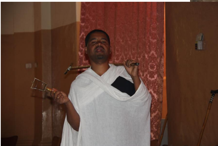
Zingende monnik in de St. George kerk.